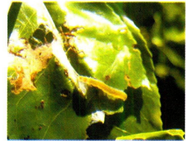
තේ ටෝට්‍රික්ස් දළඹුවා